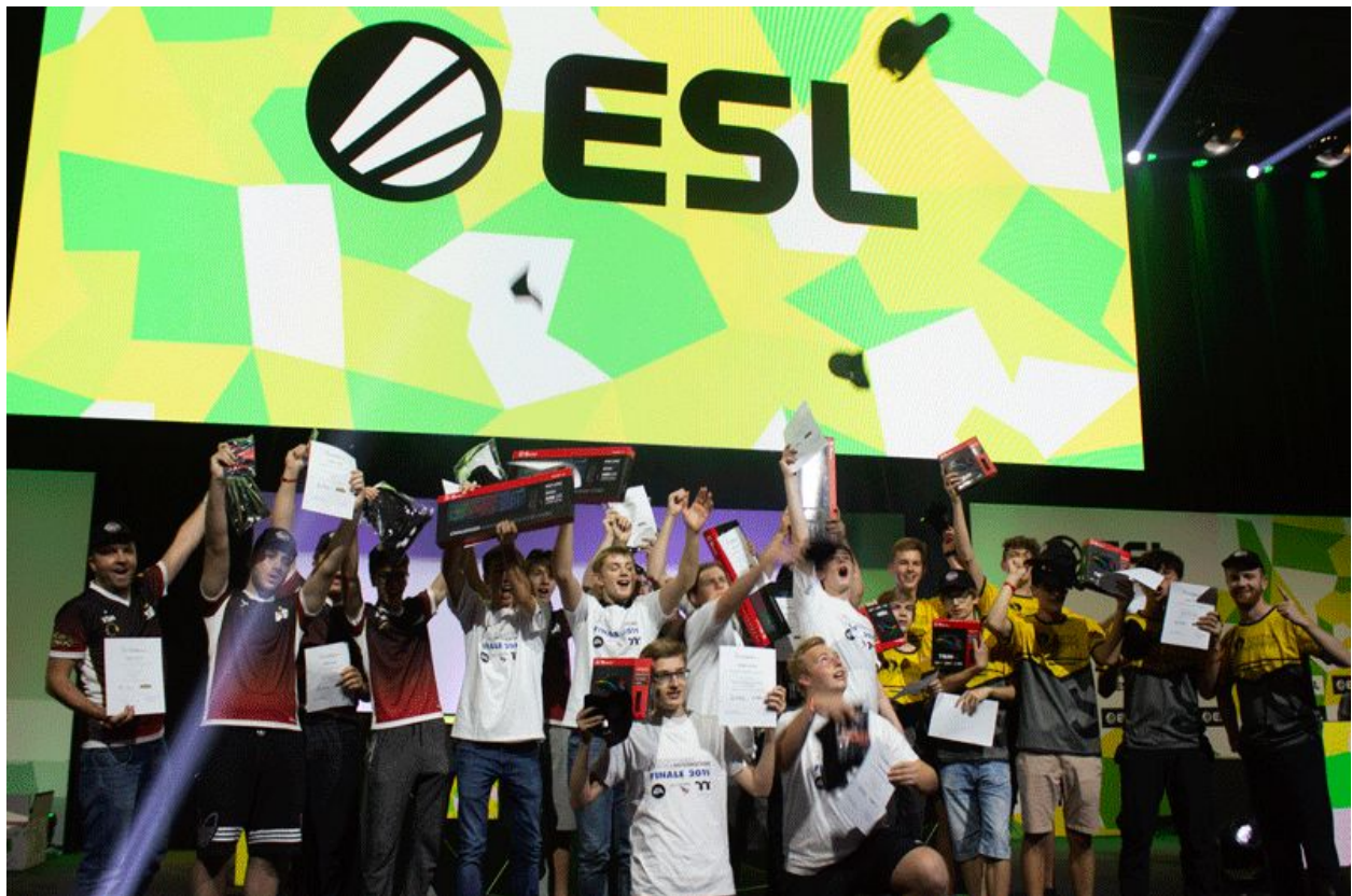
DGS Siegerehrung auf der gamescom 2019

League of Legends (LoL), das jeweils aktuelle FIFA sowie Rocket League werden aktuell in der DGS gespielt. Auf die etwa dreimonatige Online-Gruppenphase und die Play-Offs, bei denen alle Schulen via Livestream mitfiebern können, folgt während der gamescom die Finalrunde der Deutsche Games Schulmeisterschaft im Cologne Game Lab der TH Köln, unserem langjährigen Kooperationspartner. Anschließend können alle Teilnehmer*innen und Begleitpersonen dann mit Eintrittskarten von game – Verband der deutschen Games-Branche e.V. die gamescom besuchen und werden dort vor Publikum geehrt.